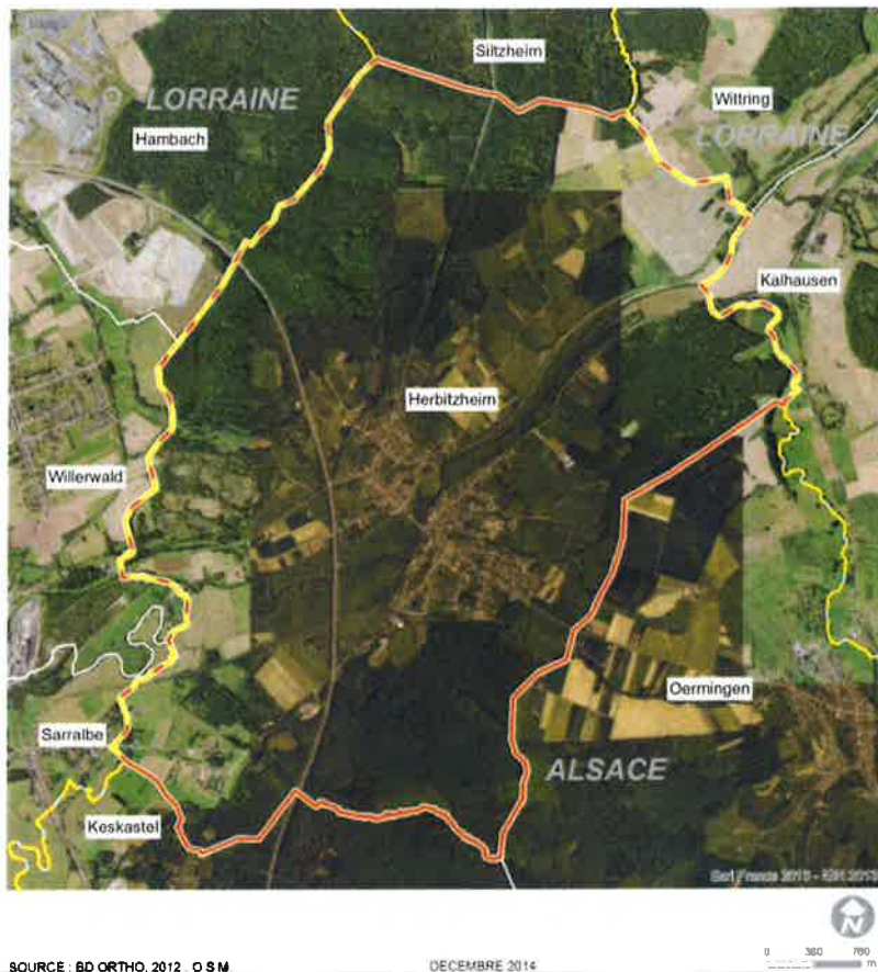
Communes limitrophes de Herbitzheim